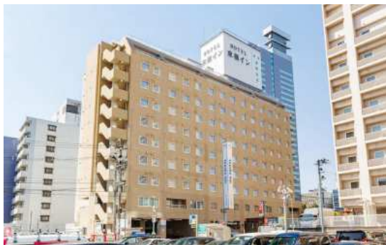
호텔 전경 사진