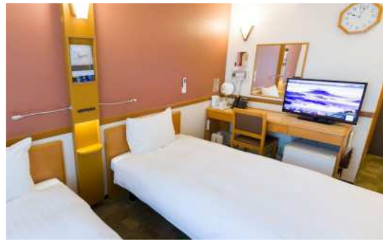
호텔 방 사진